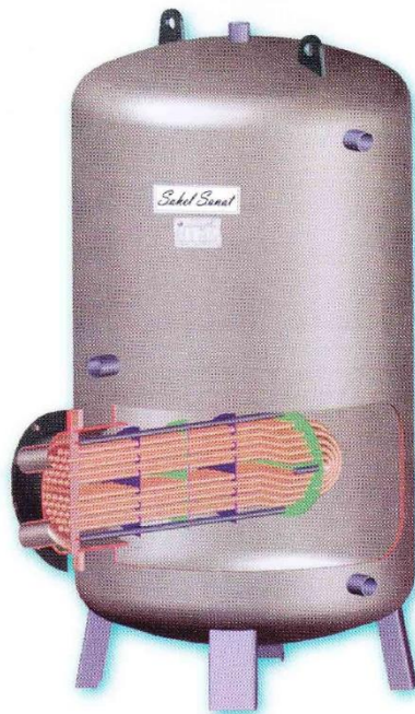
منابع کوئل دار

گارانتی منابع کوئل دار ساحل صنعت با داشتن شرایط آب تغذیه و فشار مناسب به مدت ۵ سال در نظر گرفته شده و دارای ۱۰ سال خدمات پس از فروش می باشد .